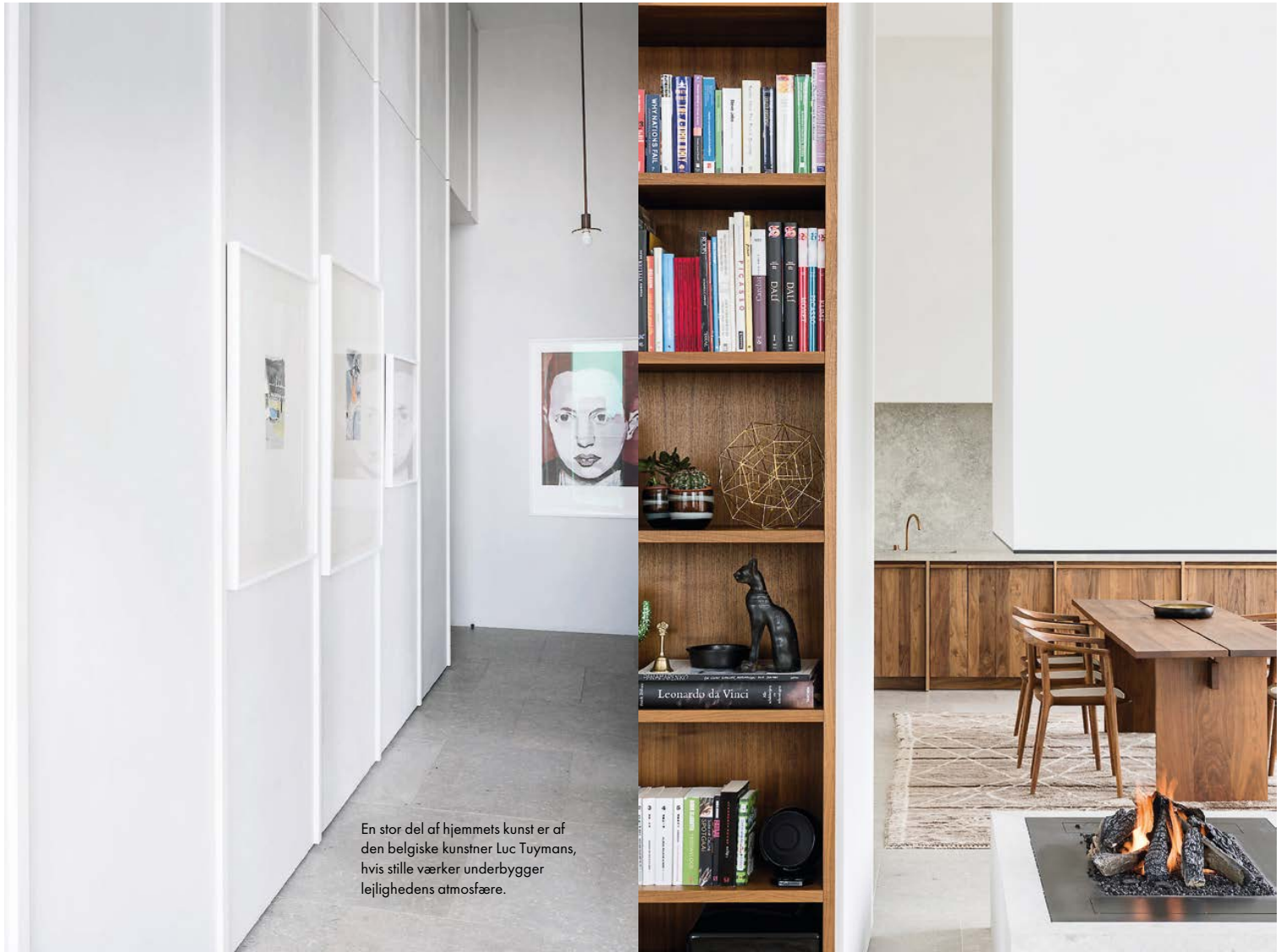
En stor del af hjemmets kunst er af den belgiske kunstner Luc Tuymans, hvis stille værker underbygger lejlighedens atmosfære.